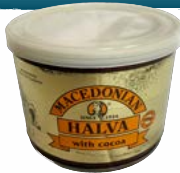
Halva Kakao 500 gr