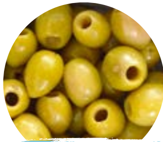
Vakuumbbeutel à 1kg / 500 gr