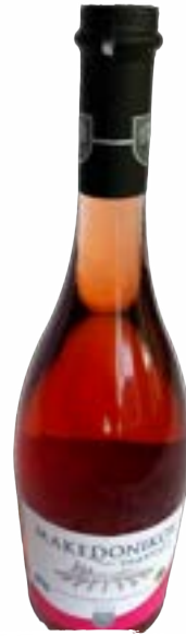
Makedonikos Rose 0,75 lt