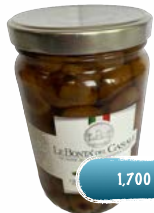
Zwiebeln in Öl.