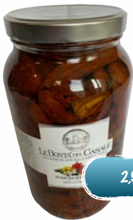
Getrocknete Tomaten in Öl.