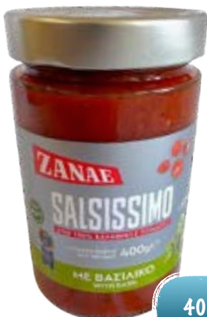
Grüne ganze Peperoni