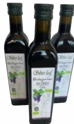
Bio Balsamico Essig 0,5 lt