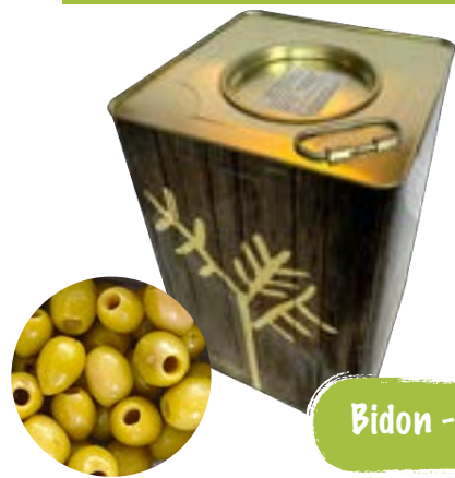
Bio grüne Oliven Mammoth ohne Stein