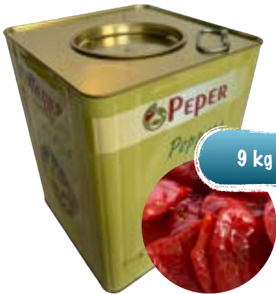
Rote Peperoni ohne Stiel