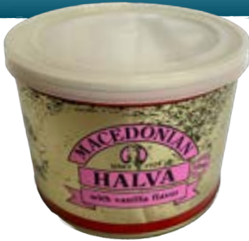
Halva Vanille 500 gr