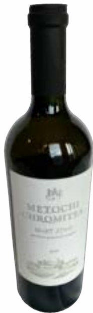
Metochi Weiss 0,75 lt