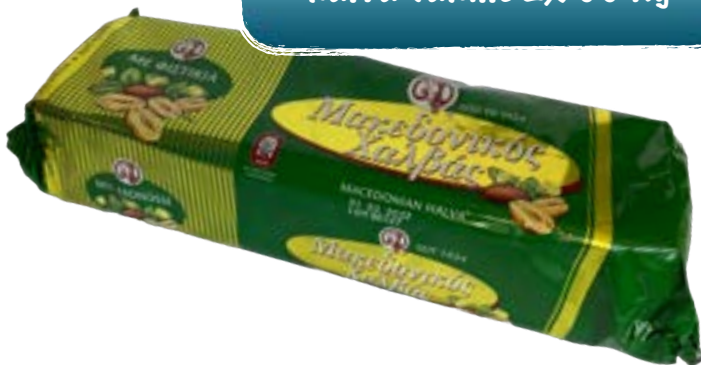
Halva Vanille 2,500 kg