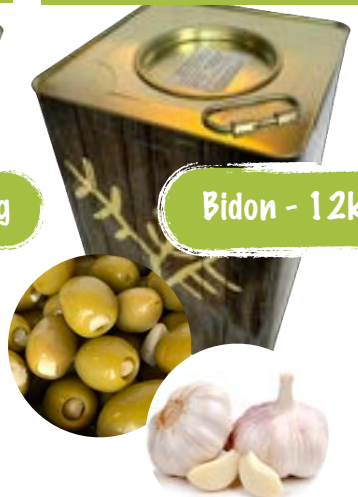
Bio grüne Oliven mit Knoblauch