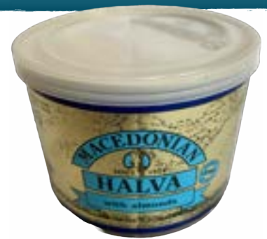
Halva Mandeln 500 gr