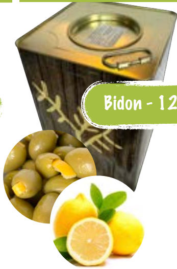
Bio grüne Oliven mit Zitrone