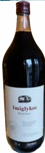
Imiglykos 2 lt