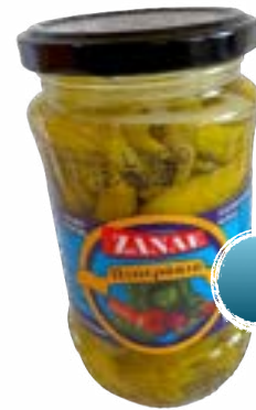
Piperakia Grüne ganze Peperoni