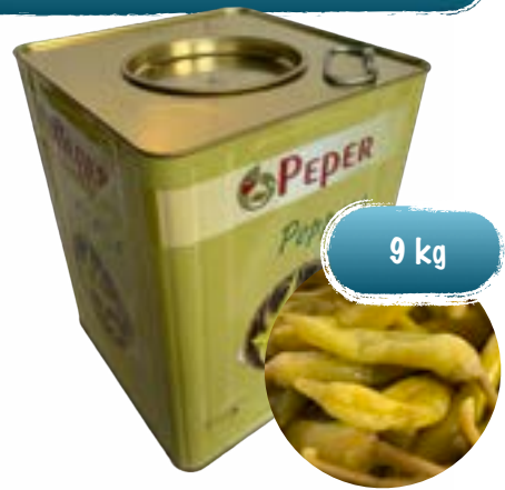
Grüne Peperoni ohne Stiel