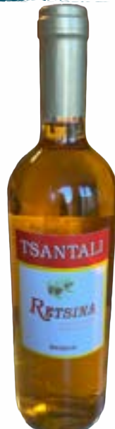
Tsantali - Retsina Weiss 0,75 lt