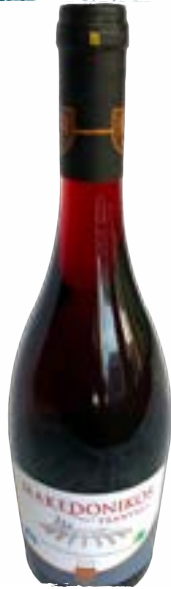
Makedonikos Rot 0,75 lt