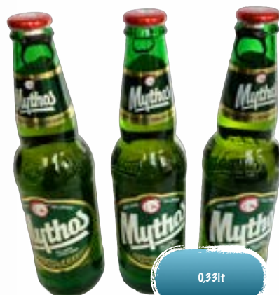
Mythos Bier - Flaschen