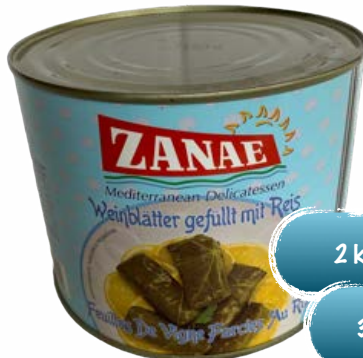
Weinblätter gefüllt mit Reis