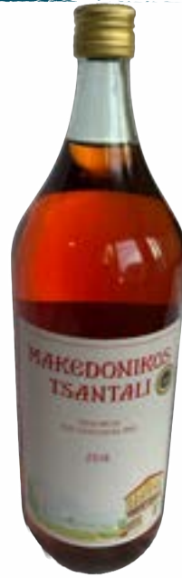
Makedonikos Rose 2 lt