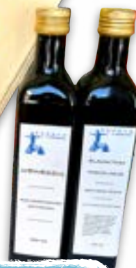
Olivenöl 0,5 lt