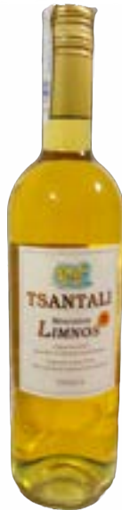
Tsantali Limnos 0,75 lt