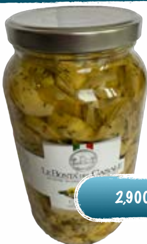
Artischockenviertel in Öl.