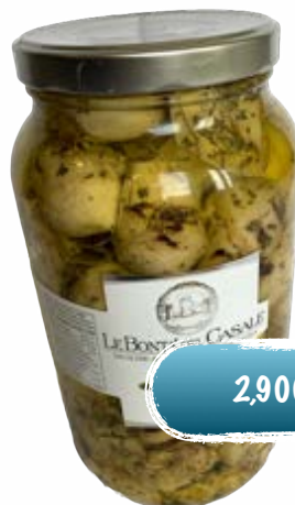
Grillierte Artischocken halbiert in Öl.