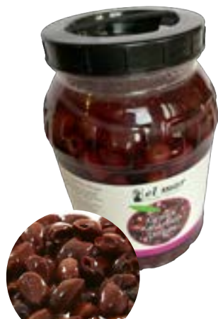
Bio Kalamata Oliven mit Stein