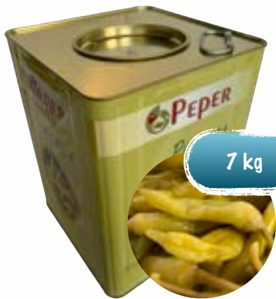
Grüne ganze Peperoni