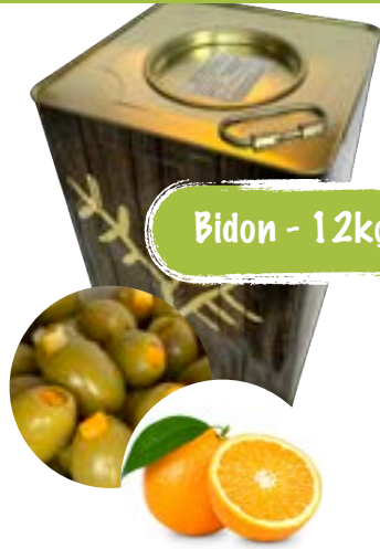
Bio grüne Oliven mit Orange