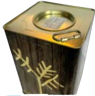
Bidon - 13 kg