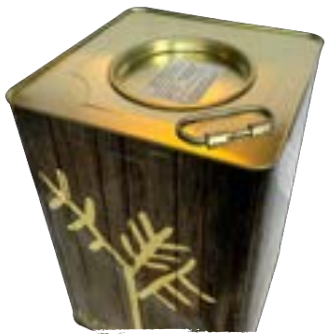
Bidon - 10 kg