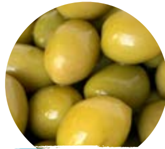
Vakuumbbeutel à 1kg / 500 gr

*Für andere M e n g e n s p r e c h e n S i e m i t u n s e r e m B ü r o