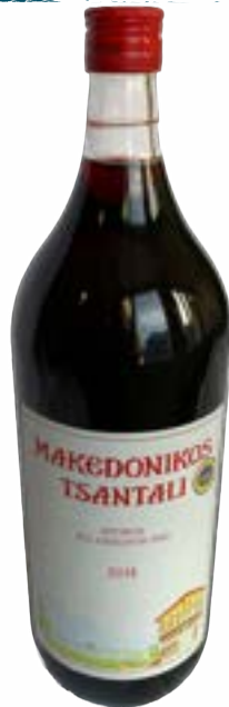
Makedonikos Rot 2 lt