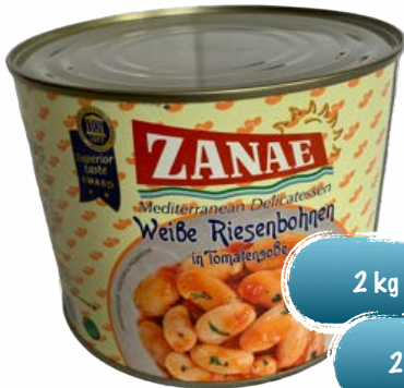
Weisse Riesenbohnen in Tomatensauce