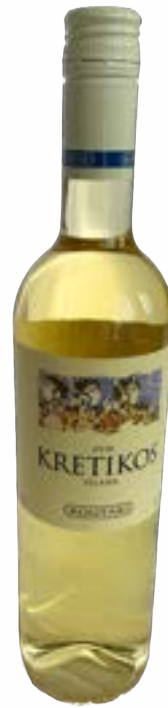
Kretikos Weiss 0,75 lt