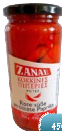
Grüne ganze Peperoni