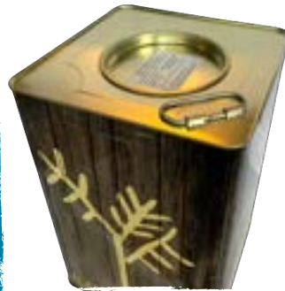
Bidon - 10 kg