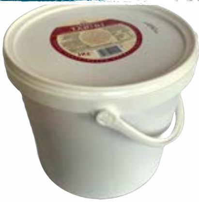
Tahini 5 kg