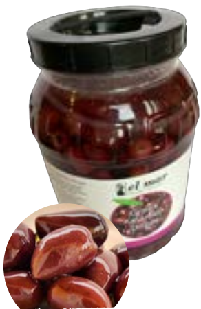
Bio Kalamata Oliven ohne Stein