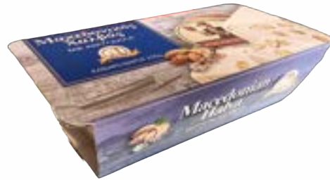
Halva Vanille 250 gr