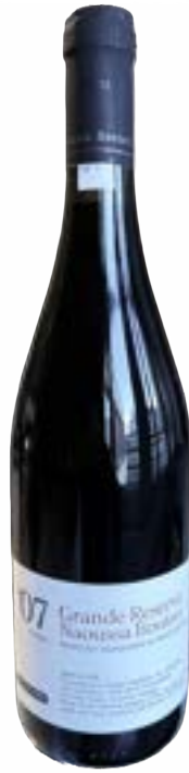
Reserve Nemea Rot 0,75 lt