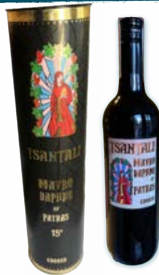
Likeur Mavrodaphne 0,75 lt