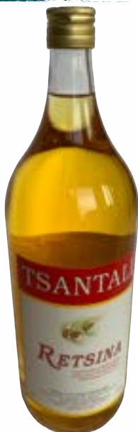
Tsantali - Retsina Weiss 2 lt