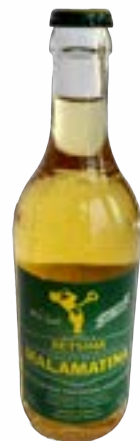
Retsina Malamatina 0,50 lt