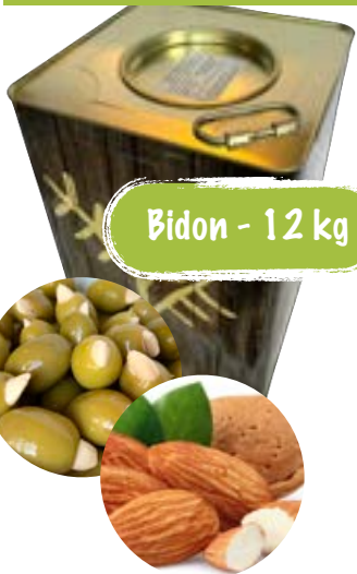
Bio grüne Oliven mit Mandeln