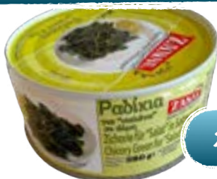
Radikia Zichorie in Salzwasser