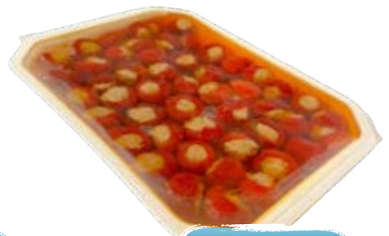
Kirschpaprika mit Thunfisch