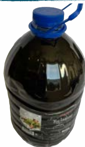
Balsamico - Rotweinessig 5 lt