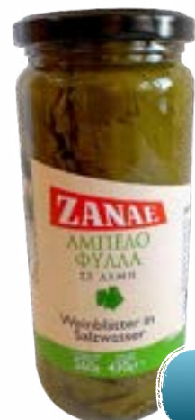
Grüne ganze Peperoni