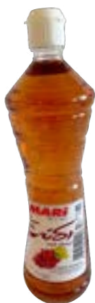
Weinessig- 400 ml